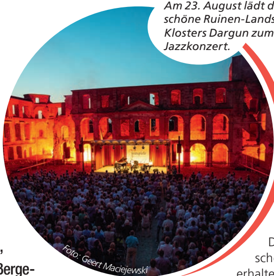
Am 23. August lädt die selten schöne Ruinen-Landschaft des Klosters Dargun zum besonderen Jazzkonzert.

Besonders in der warmen Jahreszeit singt und klingt es im Nordosten zwischen Ostsee und Seenplatte – bei unvergesslichen Musik- und Theater Vorstellungen auf spektakulären Naturbühnen, am herrlichen Ostseestrand oder vor prächtigen Schlosskulissen. Das macht die Festspiele Mecklenburg-Vorpommern aus, die das Land prägen und Musik an außergewöhnliche Orte bringen.